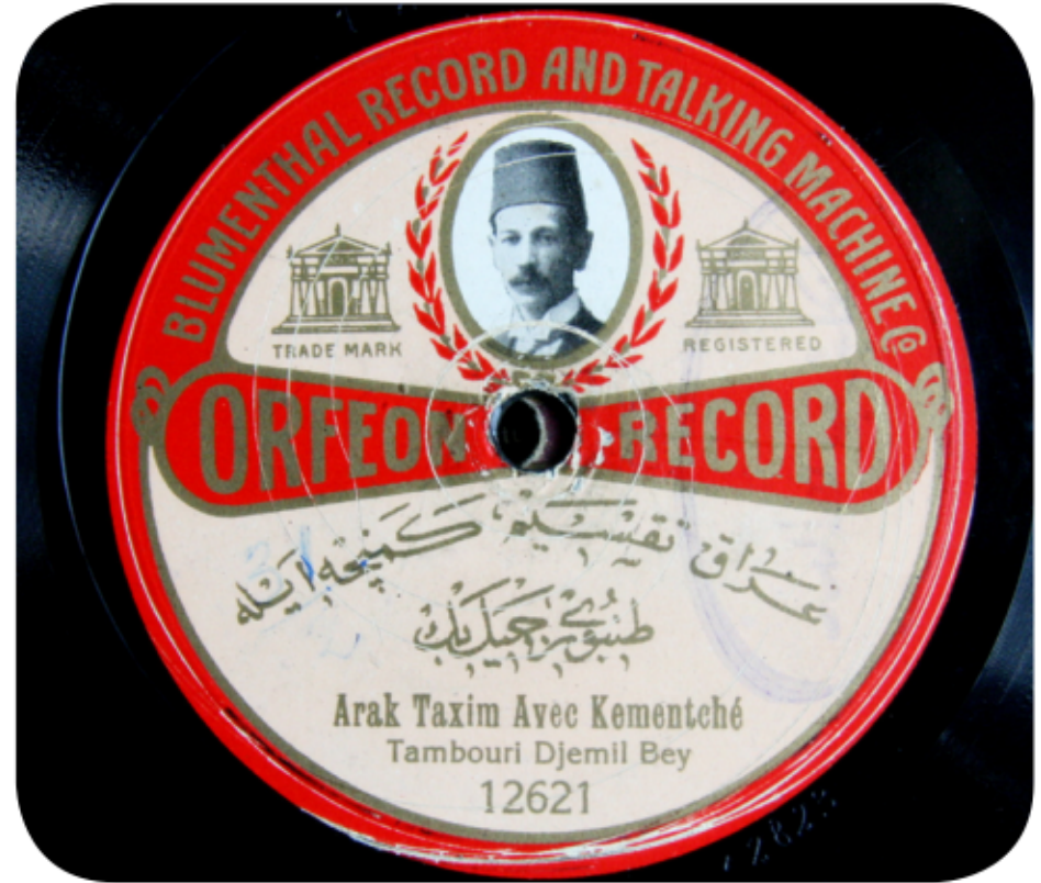
Farklı firma etiketleriyle yayımlanmış Cemil Bey plakları Cemil Bey records issued by different company labels