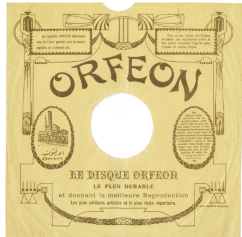
Orfeon Record plak zarfları Record sleeves of Orfeon Record