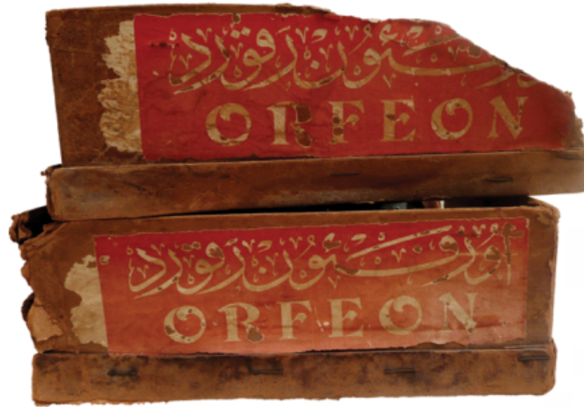
Orijinal Orfeon plak kutuları Original Orfeon record boxes

The following overview lists all Tanburi Cemil Bey's Orfeon recordings by matrix number (in bold type). As can be seen, Tanburi Cemil Bey's recordings were realized in nineteen separate recording sessions, ranging from two recordings to thirty-three recordings per session.