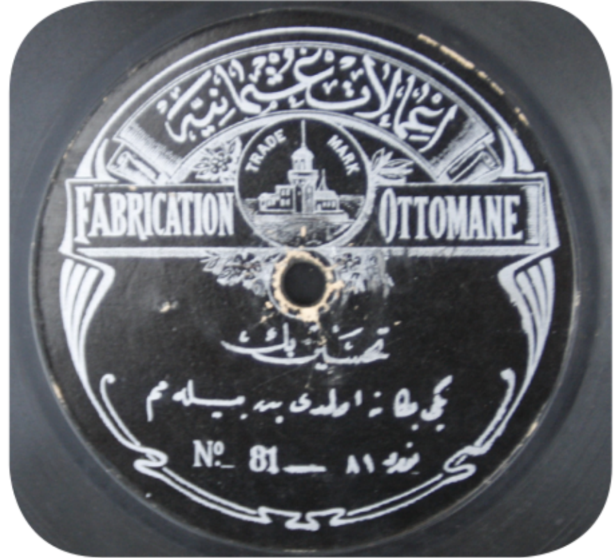
Yasal olmayan yollarla kopyalanmış Fabrication Ottomane firmasına ait Cemil Bey plakları Cemil Bey records of Fabrication Ottoman company that were copied illegally