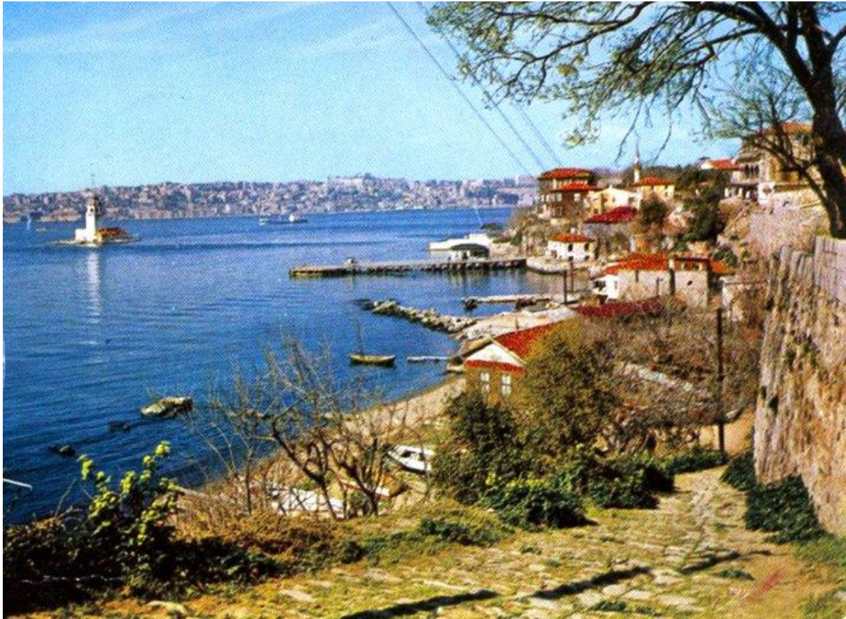
De aanlegsteiger van Salacak (midden) en Kız Kulesi (links) voordat de kustweg werd doorgetrokken