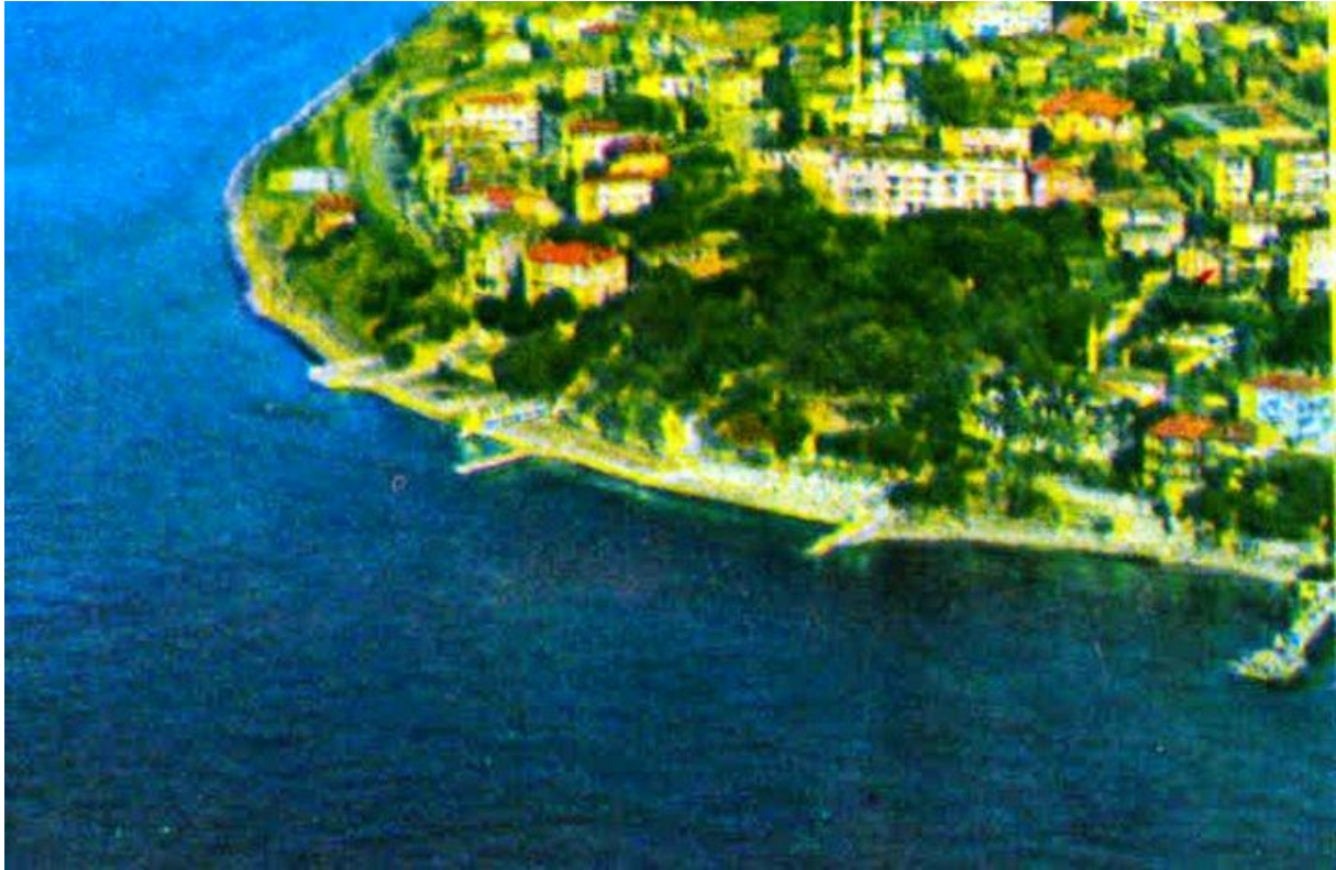
Salacak vanuit de lucht. Helemaal rechts de aanlegsteiger van Salacak. Frans zijn huis staat hier dus niet op.