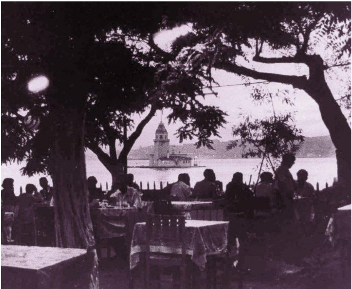
De theetuin in Salacak

De Topraklı Sokak (letterlijk: (onverharde) aarden straat ) blijkt nog te bestaan, maar is inmiddels wel omgedoopt tot Muhtar Tahsin Şahin Sokak .