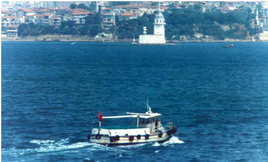
Op de achtergrond Kız Kulesi en daarachter Salacak

Wie moet mij nou die enveloppen met krantenknipsels over rebetika sturen?